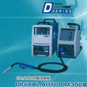
CO 2 /MAG自動溶接機 DIGITAL AUTO DM350III