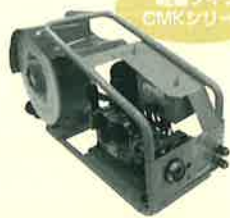
軽量タイプ CMKシリーズ