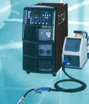
高効率アーク溶接システム D-Arc