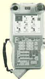
ティーチペンダント